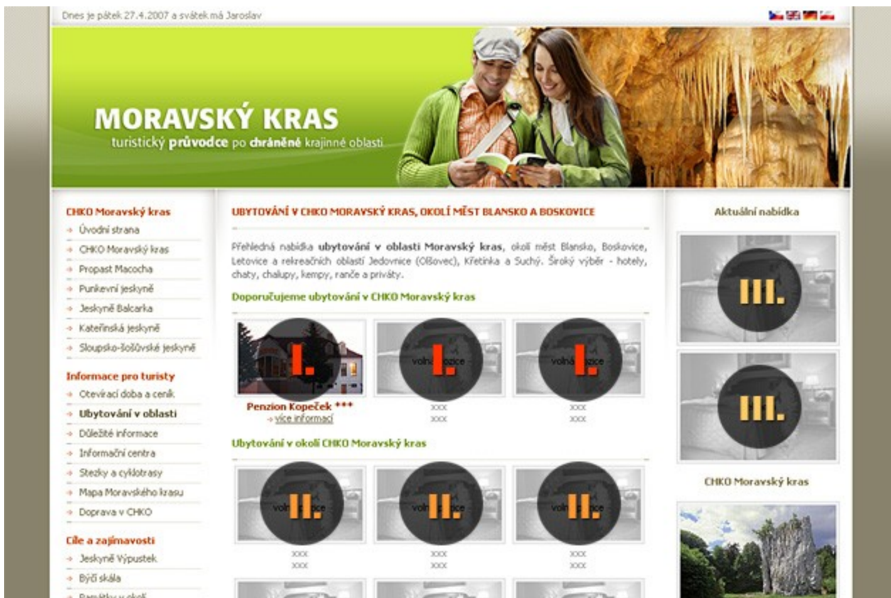
strana ubytování – reklama I., II.