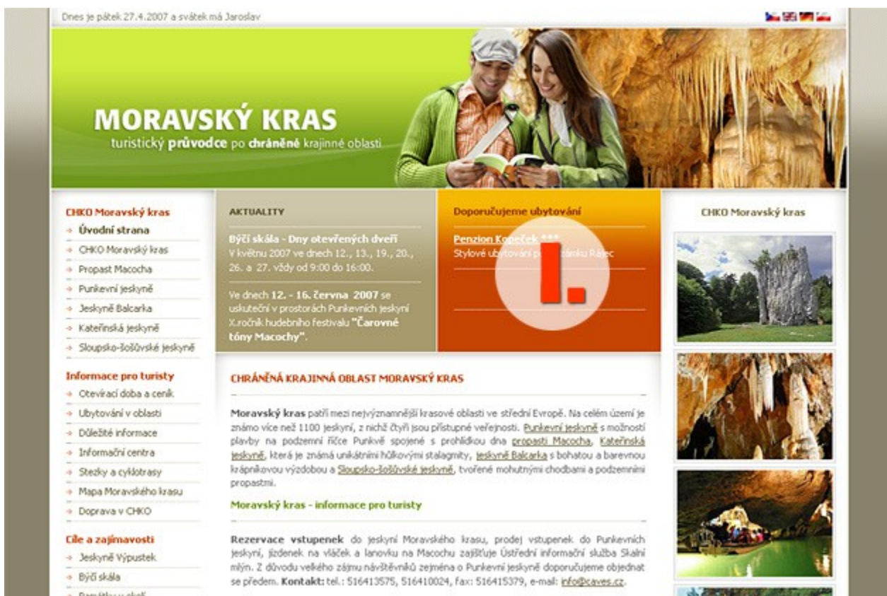
úvodní strana – reklama I.