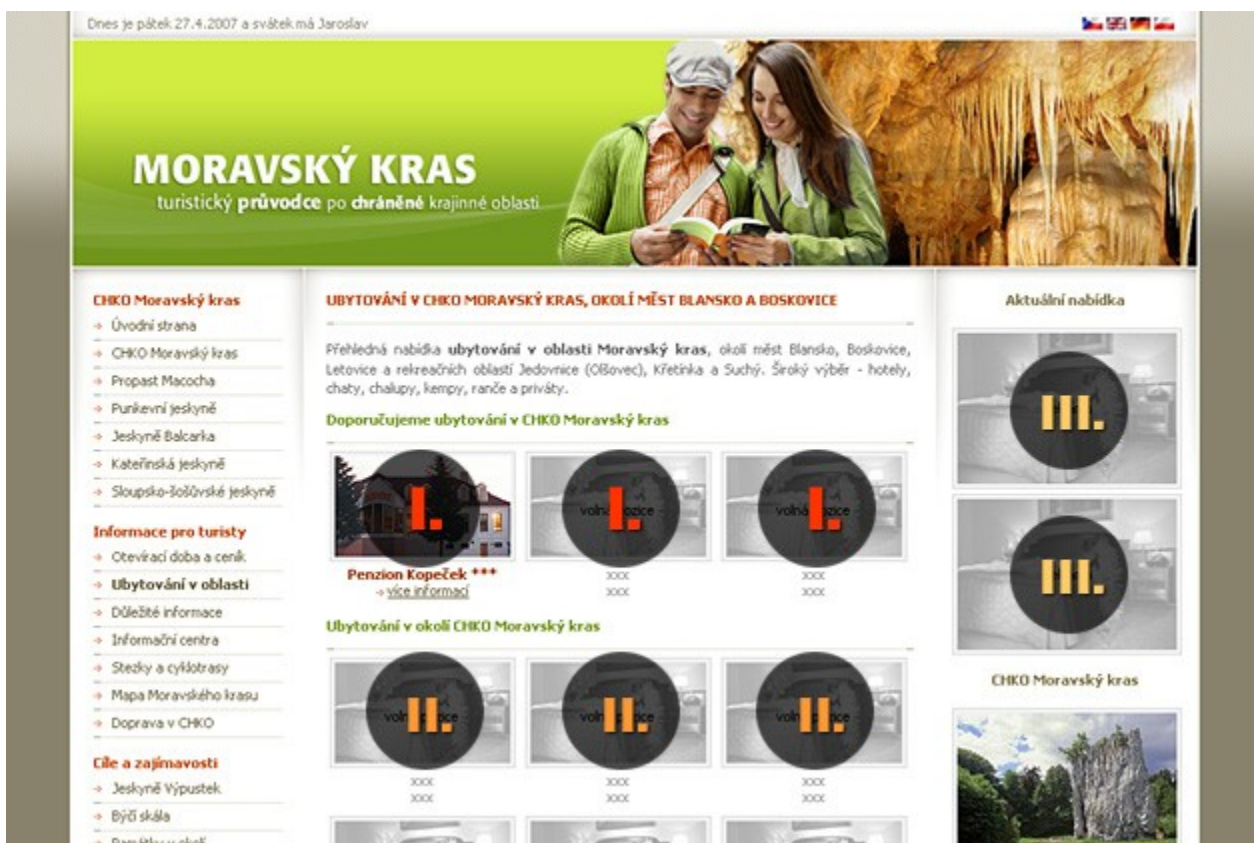
strana ubytování – reklama I., II.